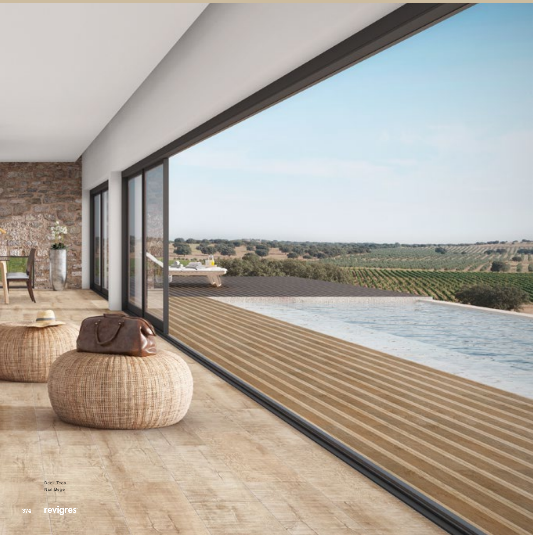
Deck Teca Naif Bege