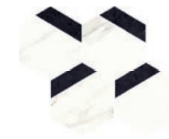
HEXA STATUARIO (a) (d) (f) 24x30 P32 /peça_pieza Base: Absolut Black Statuario White