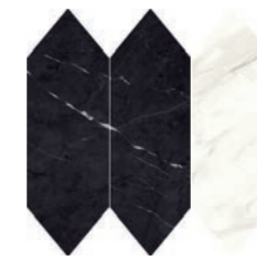
PEAK ABSOLUT(a) (d) (f) 30x30 P32 /peça_pieza Base: Absolut Black Statuario White