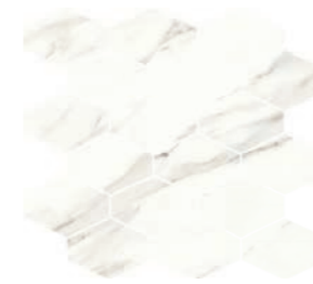
MODULUS STATUARIO (a) (d) (f) 33x37 P32 /peça_pieza